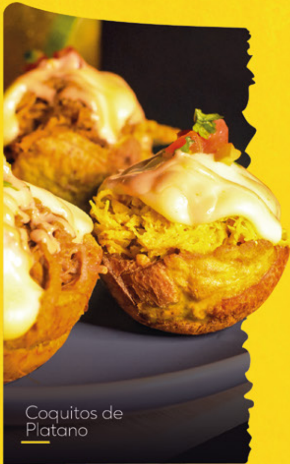
Coquitos de Platano