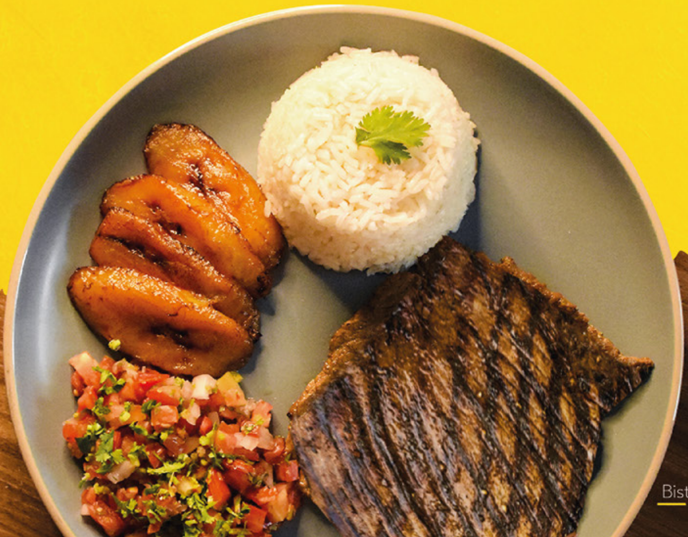
Bistec de Res

Jugosa pechuga de pollo con sazón sureño acompañada de un exquisito casamiento y pico de gallo con aderezos especiales.