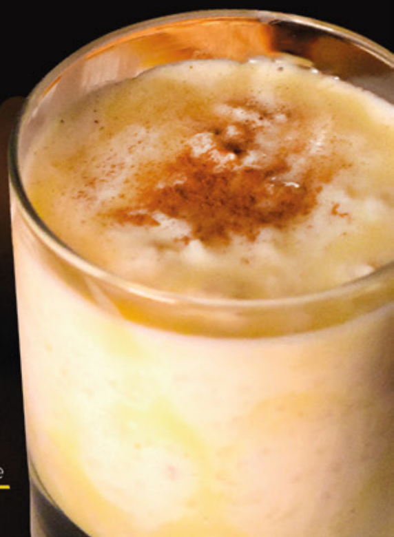
Arroz con Leche

¡De Lunes a Viernes pide tu postre que nosotros ponemos el café!