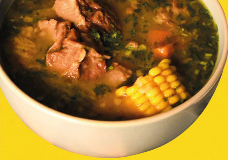
Sopa de Res